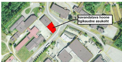
Koidu tn 22a maaüksusele kavandatava hoonelise laienduse asukoht.

OÜ Autoapteek plaanib laiendada Rapla linnas Vösa tn 40 maaüksusel olevat remonditöökohta, lisades hoonelisele kahekorruselisele osale.