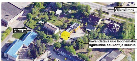
Vösa tn 40 laiendust kirjeldav pühimõttekeem.

Avatud menetluses antavate projekteerimistingimuste eelnõud avaldatakse Rapla valla veebilehel ( https://rapla.ee/projekteerimistingimused ). Avalikustamisaeg on 14.–30. juulini 2023. Vallavalitsus ootab e-posti aadressil rapla@rapla.ee või kirjalikult aadressil Tallinna mnt 14, Rapla 79513 eelnõu kohta ettepanekuid ja arvamusi. Kui ettepanekuid ei esitata või on kõiki ettepanekuid võimalik arvestada, otsustatakse asi ilma avalikul istungil arutamata.