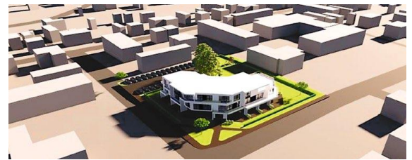
Viljandi mnt 11 detailplaneeringu illustatsioon (autorid Ivo Rebane ja Jaanika Oks, Guru Projekt OÜ).

Avaliku väljapaneku jooksul on igal õigust esitada detailplaneeringu kohta arvamusi ja ettepanekuid, mis palutakse lähetada Rapla Vallavalitsusele kirjalikult või e-postiga aadressil rapla@rapla.ee .